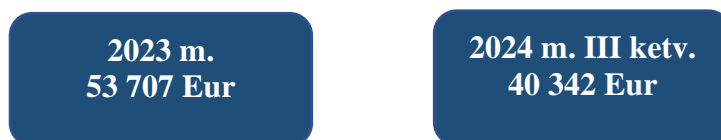
2 pav. Bendrovės veiklos rezultatai

Finansinių ataskaitų duomenimis, Bendrovės veikla 2023–2024 m. III ketv. laikotarpiu dirbo pelningai: