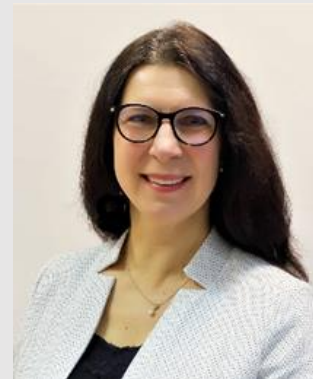
Astra Korsakienė, Savivaldybės vicemerė