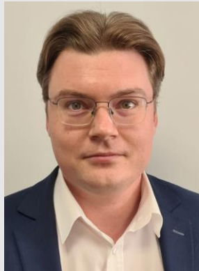
Kęstutis Knizikevičius, Savivaldybės meras (Kolegijos posėdžio pirmininkas)